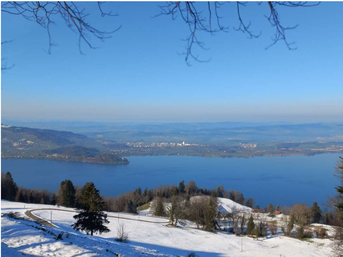
Blick vom Zugergerberg über den Zugersee

Teilnehmende: 20 Gesamtabstieg: 272 m Maximal Höhe: 1022 m ü. M. Wetter: schönes Winterwetter